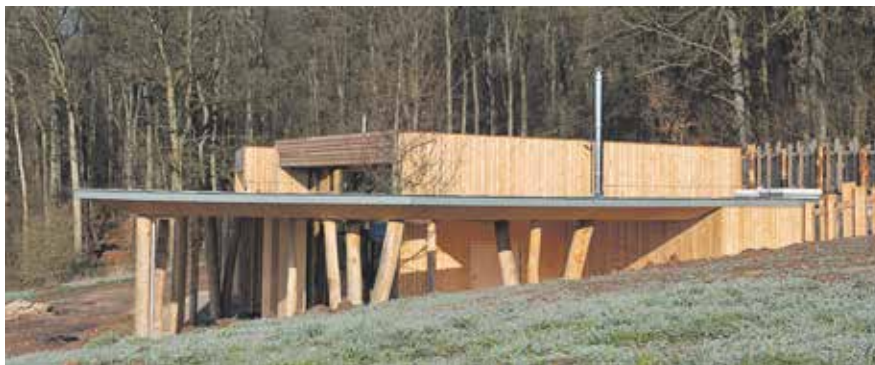
D'Bëscherche zu Betzder geplangt vun Witry & Witry

philippe.genot@luxinnovation.lu www.woodcluster.lu www.luxinnovation.lu