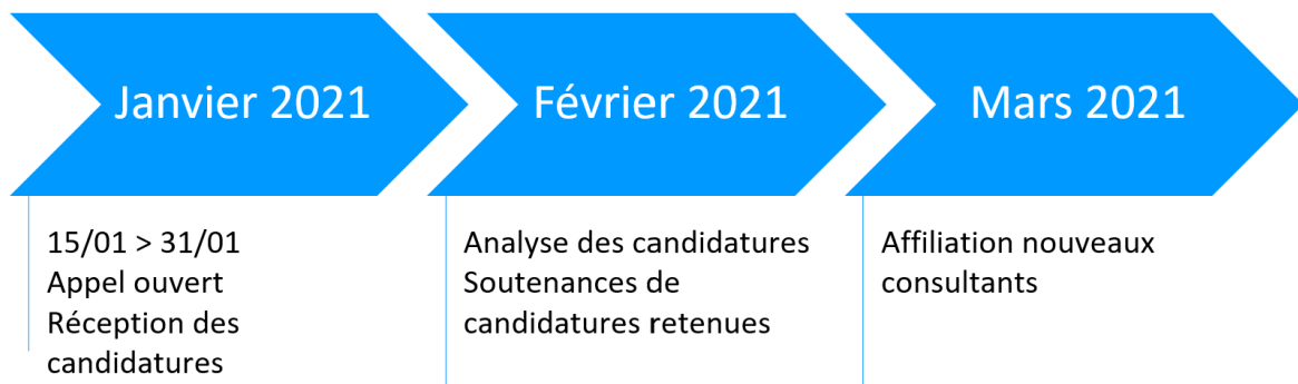
Figure 2 : calendrier de l’appel à candidature des consultants « Fit 4 Digital »